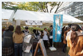
●学祭の模擬店@千葉大学

ちょうどその時開催されていた学祭にも足を運び、環境ISO学生委員会の模擬店でリサイクル本をいただきました。