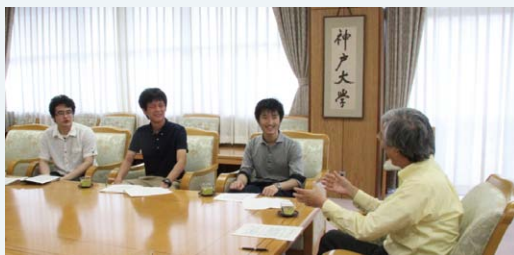
●学長との対談風景@学長室

7月に神戸大学の環境保全活動に取り組む姿勢を訊くため、福田学長との対談を行いました。対談の中で、大学の環境活動には学生の力が必要であることについて学長と意見共有しました。