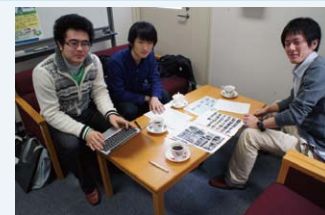
●ミーティングの様子@環境管理センター

この大学に通う一員として、大学をもっと住みよい環境に変えていきたいと思いませんか？「こういうムダを減らした方がいい」「こういうところで省エネできる」そんな考えを持っているあなた！ぜひ私たちと一緒に、これから神戸大学の素晴らしい環境を作り上げていきましょう！