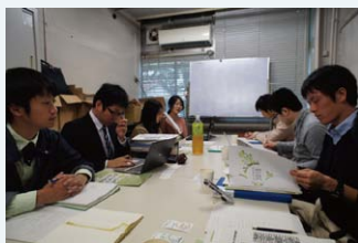
●意見交換会@千葉大学

11月に「大学に関わる環境組織」という共通点から、千葉大学西千葉キャンパスを訪問しました。千葉大学の環境ISO学生委員会との活発な意見交換の中で、両大学の環境保全活動に活かせる取り組みを話し合いました。