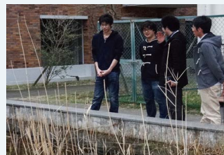
●環境サークルエコロ