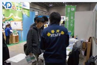
●質問するメンバー@東京ビッグサイト

12月13日～15日まで東京ビッグサイトで行われたエコプロダクツ展2012の見学に行きました。エコプロダクツ展とは企業や大学の環境への取り組みを紹介、展示した催しであり日本最大級の環境関連のイベントです。