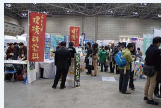
●大学ブースの雰囲気@東京ビッグサイト

そこで私たちは同じ大学という単位で積極的に環境活動に取り組んでいる千葉大学や三重大学、そして岩手大学の展示等を見学し、実際にお話を伺いました。また、企業が行っている取り組みについても聞いてきました。