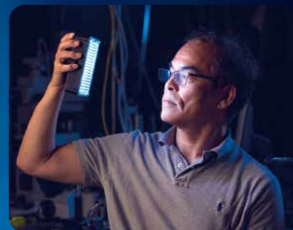
中村 修二 教授

1954年、愛媛県生まれ。79年に徳島大学大学院工学研究科修士課程修了後、日亜化学工業に入社。88年から1年間フロリダ大学電子工学部へ留学後、93年、高輝度青色発光ダイオードを開発。99年に日亜化学工業を退社後、翌年、カリフォルニア大学サンタバーバラ校材料物性工学科教授に就任。