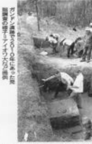
ジャワ島のサンギラン遺跡。約100年前に発見された遺跡の掘り出し物。