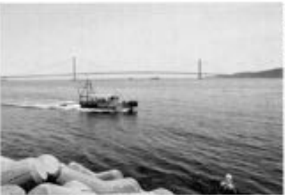
兵庫県瀬戸内海の瀬戸内海でイカ釣り漁船が漁獲する様子。船中から漁獲されたイカが写っている。

【本紙記者 兵庫】瀬戸内海の漁獲量が回復を遂げようとしている。漁業者は、これまで減少していた漁獲量を回復させるために、一か八かの賭けに出ている。瀬戸内海の漁獲量は、近年減少傾向にあるが、漁業者は、これまで減少していた漁獲量を回復させるために、一か八かの賭けに出ている。