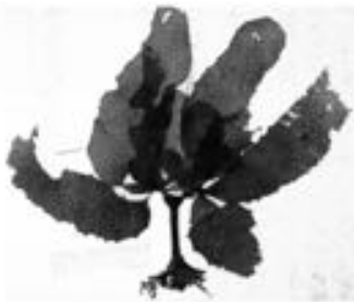
サガラメ

「サガラメは、みずけの風や日照にしたり、暑がいたものを削いで乾燥にかけたりと、様々な食べ方があります。伊勢神宮（三重県伊勢市）で供物として使われるなど、古くから食用にされてきました。