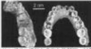
サンギラン遺跡から出た約90万～110万年前の下あご一対。