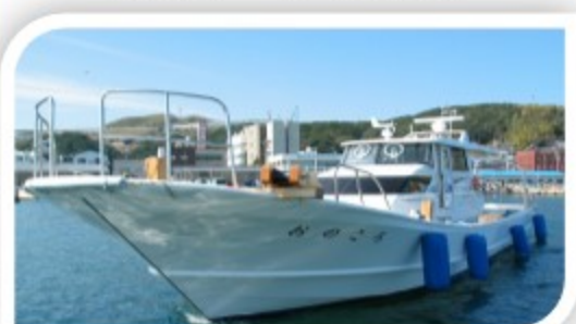
調査実習船「おのころ」