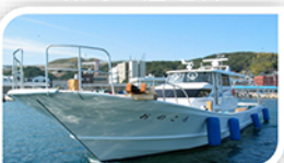
調査実習船「おのころ」